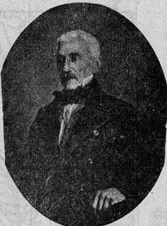
JOSE DE SAN MARTIN Haguenotipa (1848).